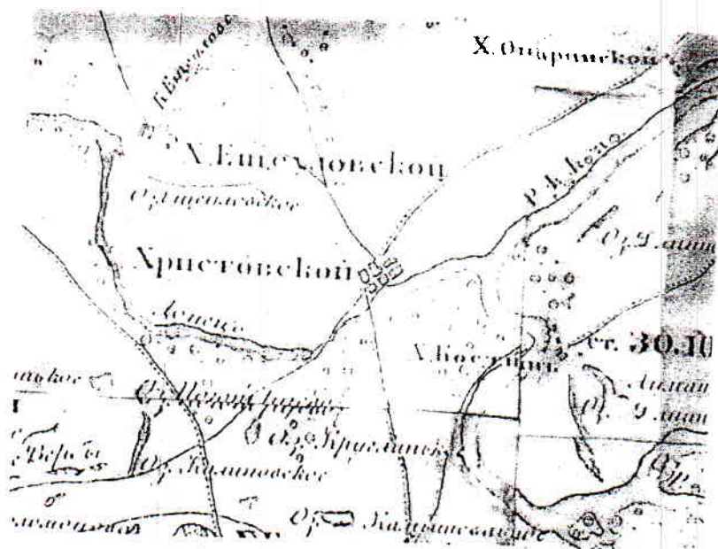
Фрагмент карты "Область Войска Донского. 1880 г.

И последняя версия - в основе названия хутора лежит чисто географическое его местонахождение. Хутор располагался как бы на перекрёстке двух рек. Северский Донец, впадая в Дон, образует дельту с рукавами в виде лучей креста.