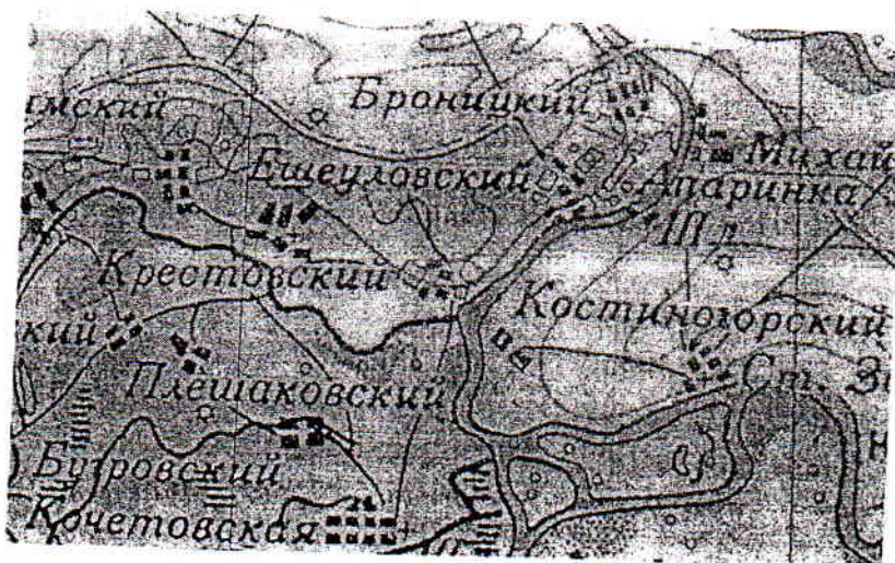
Фрагмент карты "Ростовская область. 1943 г.

В советский период хутор в перечне населённых пунктов Ростовской области и на географических картах именовался Крестовским. Сами жители называли свой хутор Кресты.